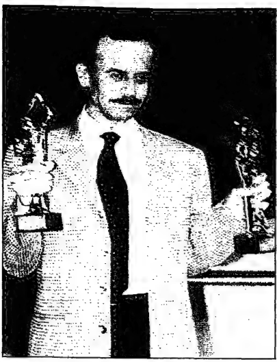
محمد تصوير (القلم العربي)